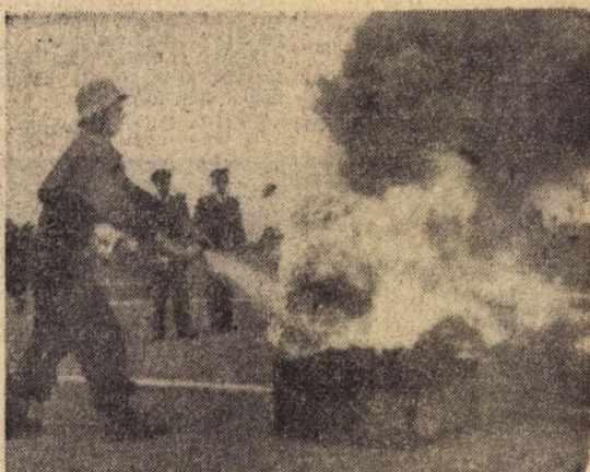
Az állami tűzoltók akadályversenyének utolsó mozzanata: oltás kézi gázkészülékkel

munkával fejlesztik tudásukat. Meg kell emlékezni a vértessomló testületről. Két csapatuk ismét a megyei győztesek közé került. S ebben a