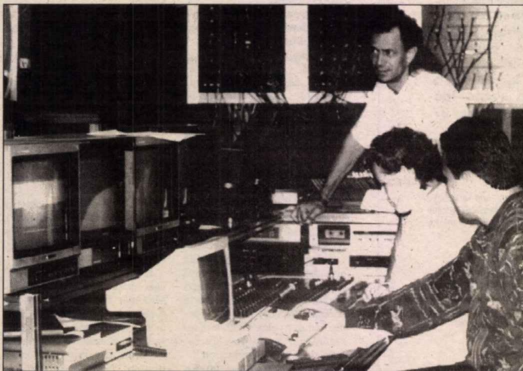
A viszonylag jól felszerelt stúdióban minden adás előtt együtt dolgoznak a kollégák