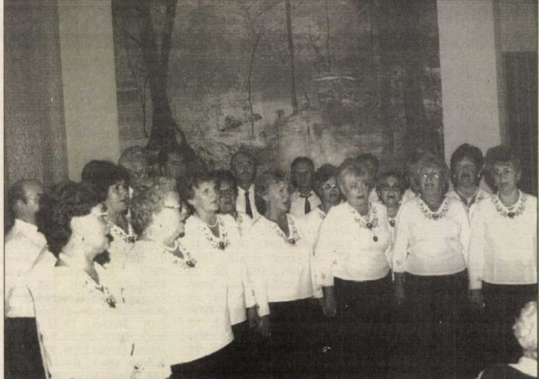
A kitüntetett kórus

A műemlékegyüttest sokan felkeresik, a múlt színeiben több mint huszonháromezer belépőt sikerült eladnunk. De sokszor jönnek a város vagy a fenntartó cégek vendégei is, nyaranként nálunk funkcionál a Közművelődés Háza kulturális rendezvénysorozata, a Majki Nyár,