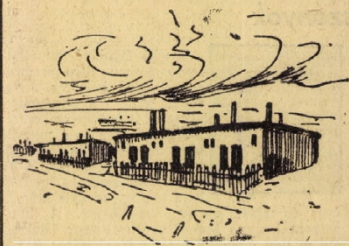
Régi oroslányi barakkok.

H a a helység várossá alakul, rendszerint megkérdik, hogyan fejlődött odáig, mivel érdemelte ki a megtisztelést. Oroszlány város esetében nehéz a mulat megmutatni, mert