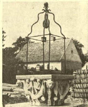
● Márványkávás kút, kovácsoltvas részel.